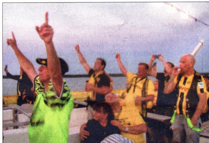
Während der gesamten Schiffsfahrt herrschte, wie hier beim Feuerwerk, eine ausgelassene Stimmung.