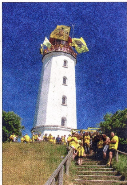
Ein seltenes Bild – der Leuchtturm Dornbusch wird von BVB-Fans belagert.