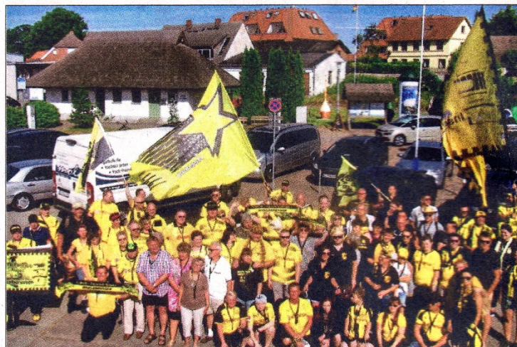
Alle Teilnehmer der Ausfahrt nach Hiddensee vor dem Betreten des Schiffes.