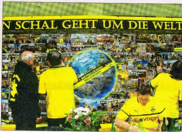
Fand reges Interesse - Das Poster „Ein Schal geht um die Welt“

Auf der Jahreshauptversammlung des BVB-Fanclubs „Inselborussen“, an der am 18. Januar 2020 im Jugenddorf Drewwoldke insgesamt 72 „Inselborussen“, „Calbenser Borussen“ und „Borussen-Sterne“ aus Dortmund teilnahmen, erregte ein überdimensionales Poster für Aufsehen und reges Interesse. In mühevoller Kleinarbeit hat Rene Reichard 152 Fotos mit dem Fanschal der Inselborussen zusammengetragen und auf einem Poster mit den Abmessungen von 4,5 x 2 m verewigt. Die Aufnahmen zeigen den Schal in 58 Städten von 19 Ländern. Die Reaktion war so positiv, dass bereits weitere Fotos eingetroffen sind und ein weiteres Poster in Arbeit ist. Danke Rene für diese fleißige Arbeit.