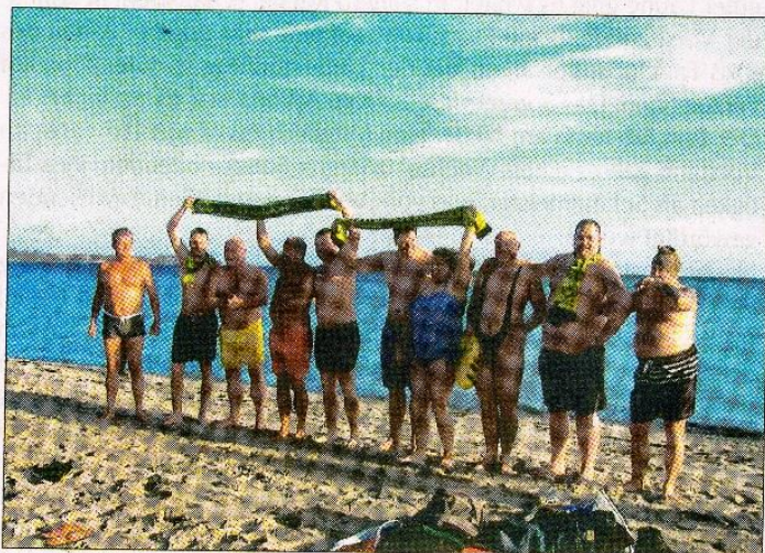
Zeigten Härte - „Inselborussen“ und „Calbenser Borussen“ vor dem Bad in der kalten Ostsee

Traditionsgemäß fand auch in diesem Jahr das Anbaden statt. Bei Außentemperaturen von 6 Grad und Wassertemperaturen von 4 Grad fanden sich am 18.01. um 11:00 Uhr Vertreter der „Inselborussen“ und „Calbenser Borussen“ am Strand von Juliusruh ein, um sich in die kalten Fluten zu stürzen.