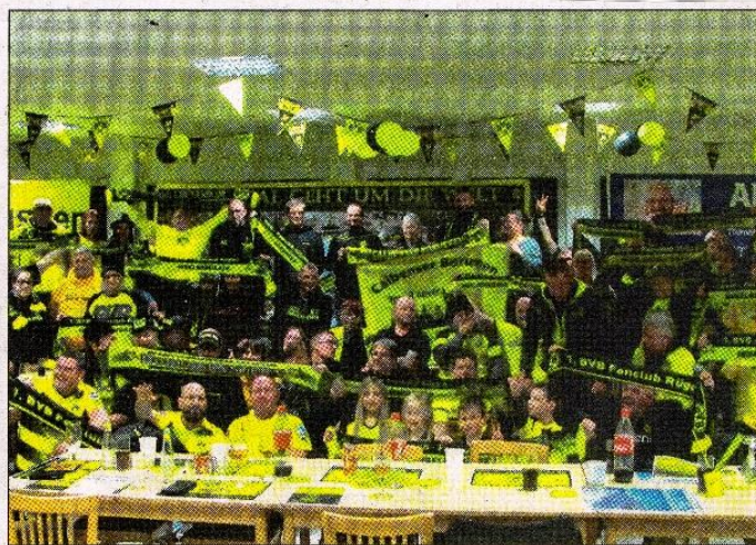
Demonstrierten Geschlossenheit - „Inselborussen“, „Calbenser Borussen“ und „Borussen-Sterne“ aus Dortmund

!!! Das diesjährige Sommerfest musste auf Grund der Corona-Krise leider abgesagt werden !!!