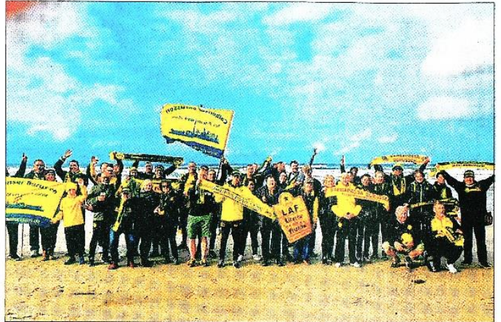
Vereint eine Macht — BVB-Fans aus der gesamten Bundesrepublik am Strand von Bakenberg.