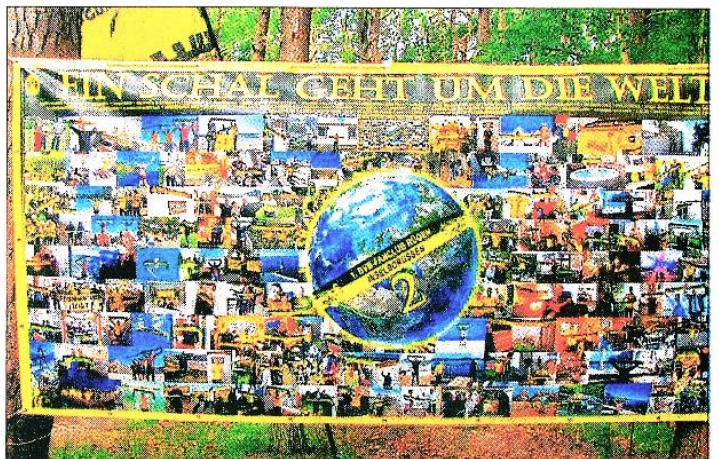
Fand reges Interesse — das 2. Poster „Ein Schal geht um die Welt“.